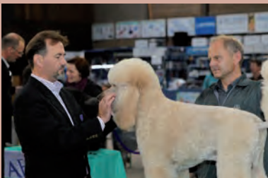
Impressionen der Veranstaltung