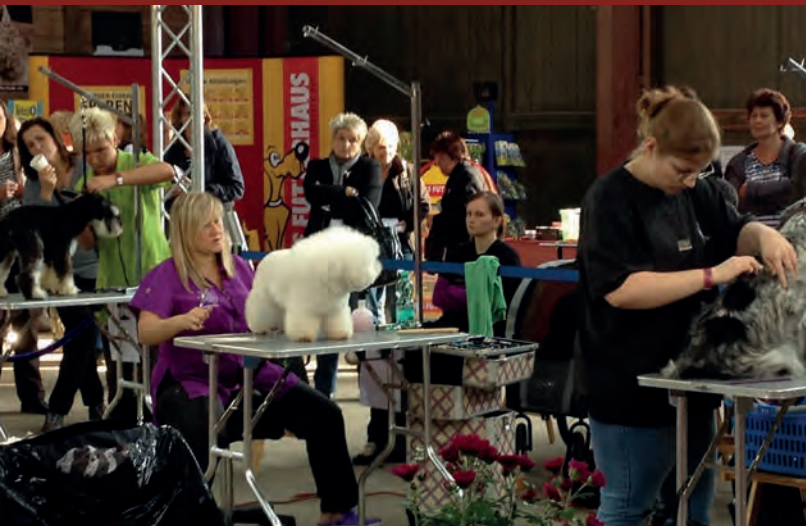
Groomer im Wettkampf