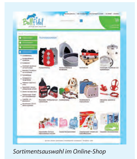
Sortimentsauswahl im Online-Shop

Seit Juni 2013 bietet Bellfidel seinen Geschäftspartnern ein neues Einkaufserlebnis. Auf dem Großhandelsportal