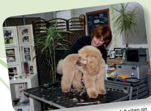
Konzentriertes Arbeiten an praktischen Beispielen