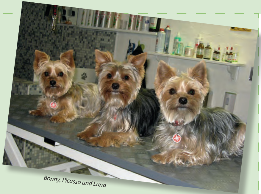
Bonny, Picasso und Luna

Merwel Otto-Link www.hundepflege-otto-link.de